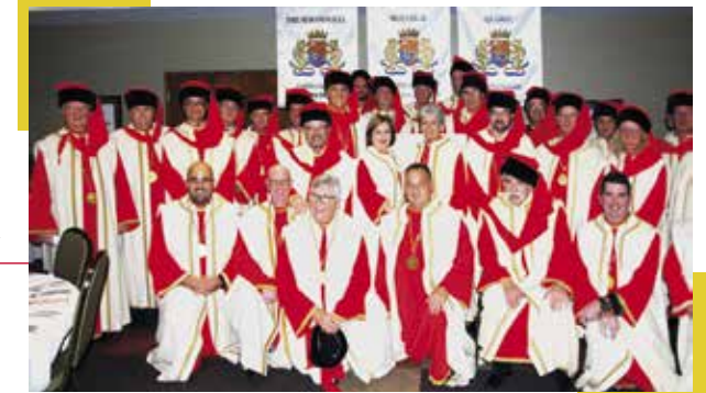
Chapitre au Canada ▶