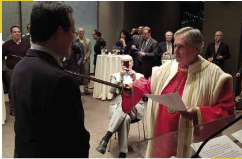
▲ Chapitre de décembre 2018 au restaurant Riverpark situé à Kips Bay, New York

La Baronnie de New York est active, conviviale et respectée et salue fraternellement toutes les Baronnies du monde entier à l'occasion des 50 ans de notre Commanderie.