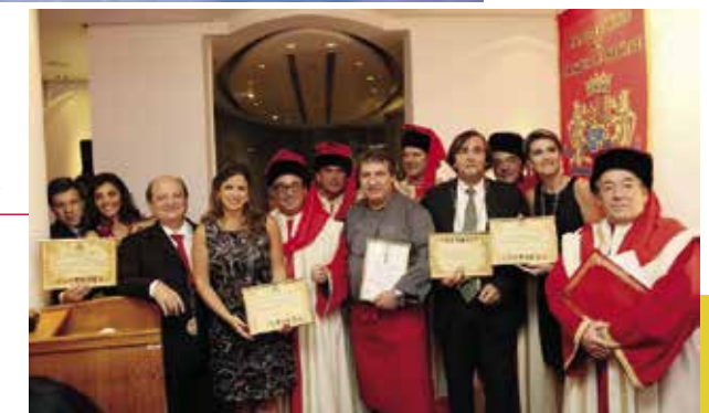
Chapitre à Rio de Janeiro ▶