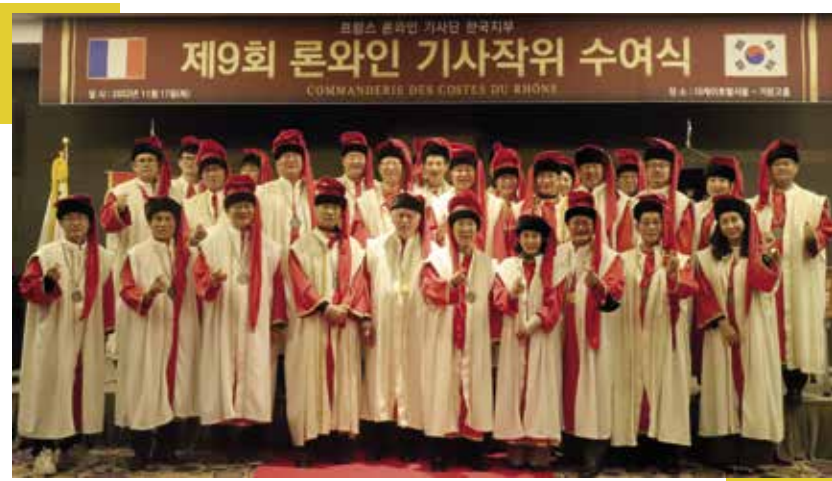
▲ Chapitre de novembre 2022 à Séoul

La Baronnie va fêter ses 10 ans cette année et sera bien présente avec une forte délégation en France pour les 50 ans de la Commanderie en juillet.