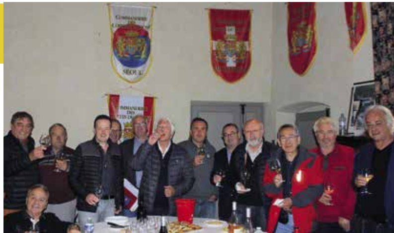
▲ Le bureau 2023