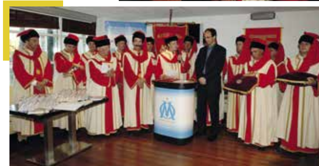
◀ Chapitre à Marseille