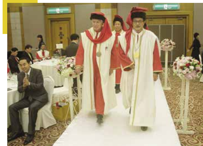
▲ Le grand Maître et le Consul de Séoul

Si trois politiques importants du parlement de la Corée sont venus rejoindre la Baronnie, on remarquait l'intronisation