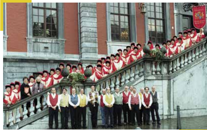
▲ Réception à l'hôtel de ville de Liège pour les 15 ans de la Baronnie

Longue vie à la Baronnie liégeoise, longue vie à la Commanderie des Costes du Rhône !