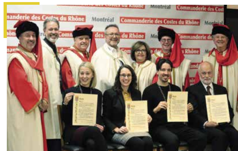
▲ Les intronisés du 85 ème chapitre du 17 novembre 2022 avec les Commandeurs et officiers de la Baronnie

Lors de ces 86 chapitres solennels, 489 personnalités des milieux de la culture, des arts, de la musique, du spectacle, des médias d'information, des métiers de bouche, de la sommellerie, du sport, de la politique et des affaires ont été intronisées Chevaliers et Chevalières de la Commanderie des Côtes du Rhône.