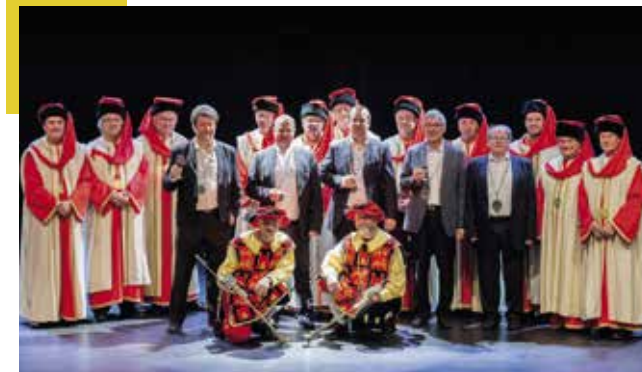
◀ Chapitre à Montreux