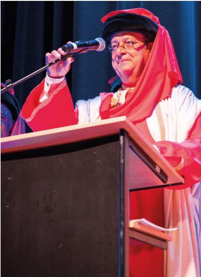
Wijn en traditie gaan hand in hand...