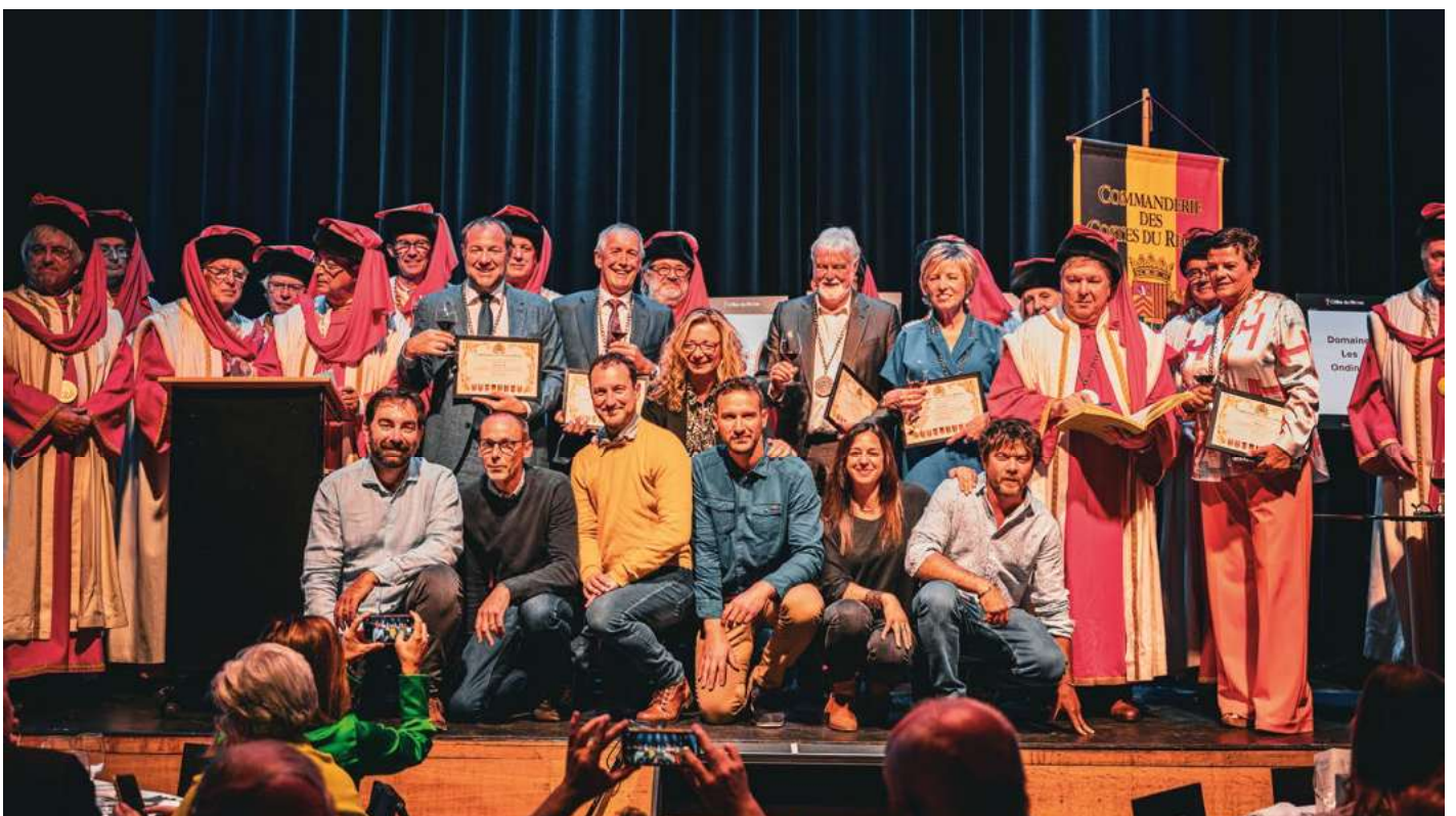
De Baronie Gent van Commanderie des Costes du Rhône viert zijn twintigste verjaardag.

Tijd dus om deze appellatie eens in de picture te plaatsen en de Vlaamse wijnproever kennis te laten maken met al het schoons van deze regio van de zuidelijke Rhône. Op deze manier ontstond een fijne samenwerking tussen de Baronie Gent van de Commanderie des Costes du Rhône en de Vlaamse Wijngilde, die resulteerde in een salon en een gala-kapittel op 8 juni 2024, voorafgegaan door diverse workshops rond Vacqueyras. Het werd uiteindelijk een fantastisch driedaags event, waarmee we