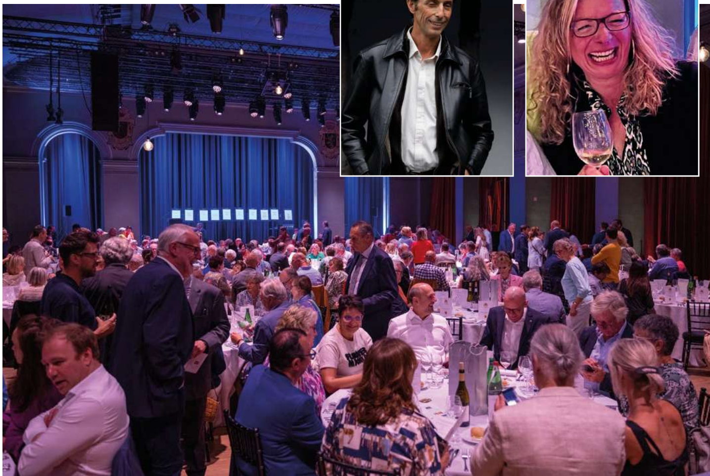
Tijdens de vacqueyrashapping in de Handelsbeurs in Gent konden honderden wijnliefhebbers de grote diversiteit aan wijnstijlen in deze regio persoonlijk ontdekken.

meer dan 1.000 wijnliefhebbers hebben kunnen sensibiliseren (via het salon, gala, webshop, workshops, ...) voor de wijnen van AOP Vacqueyras.